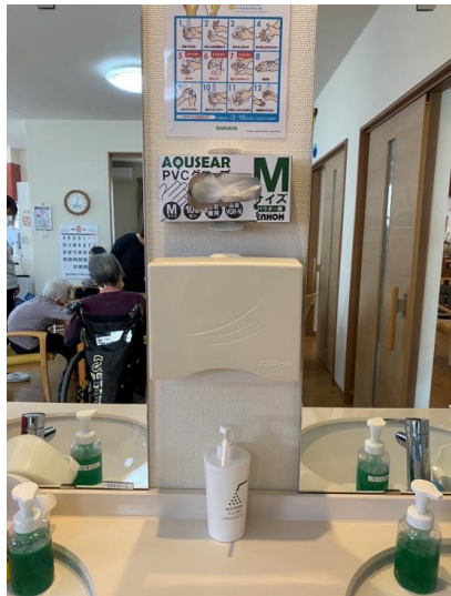
必要なモノを必要な場所へ！ 知識を知恵へ！