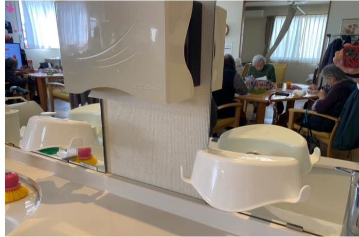
乾きやすく使いやすい！