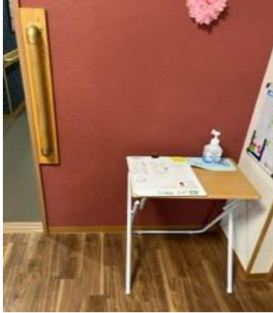
消毒液の設置箇所が増え始めました！